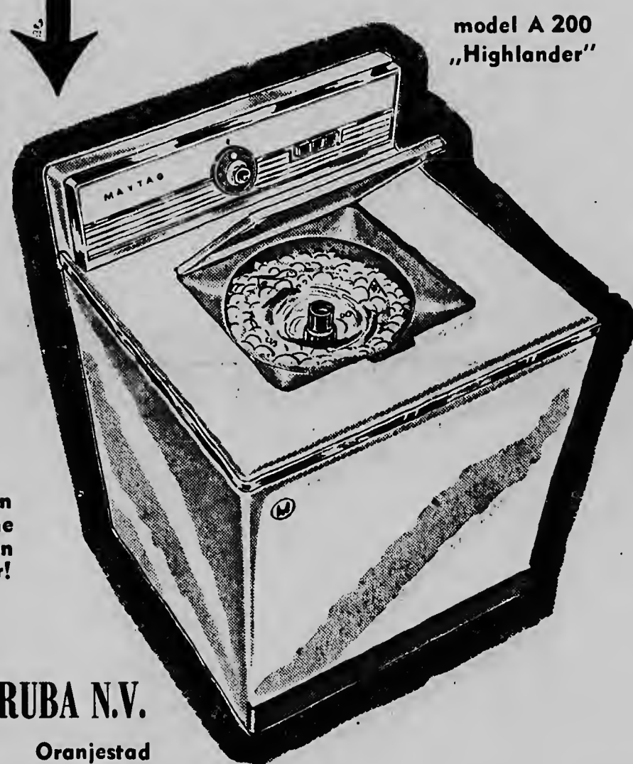
model A 200 „Highlander”

Bij aankoop van een MAYTAG wasmachine ontvangt u gratis een PHILIPS strijkijzer!